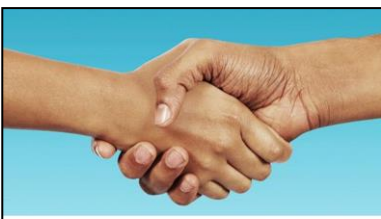
MANOS QUE DAN AMISTAD