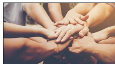
MANOS QUE TRABAJAN UNIDAS, EN EQUIPO