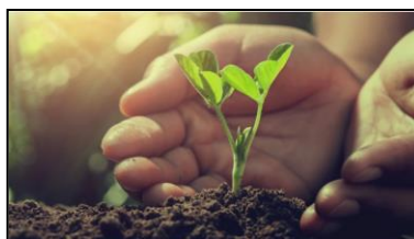
MANOS QUE CUIDAN LA NATURALEZA