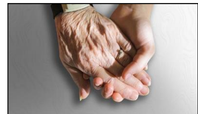
MANOS QUE CUIDAN