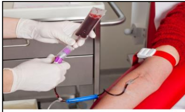
MANOS QUE COMPARTEN