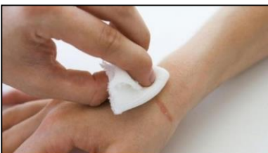
MANOS QUE CURAN