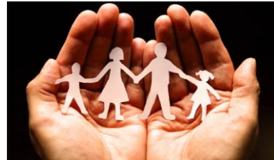
MANOS QUE PROTEGEN