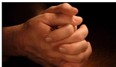
MANOS QUE REZAN