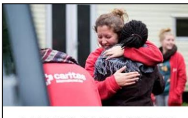
MANOS QUE ACOGEN