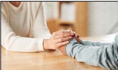
MANOS QUE CONSUELAN