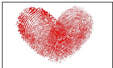
MANOS QUE DEJAN HUELLA