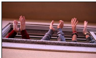
MANOS QUE APLAUDEN LAS ACCIONES BUENAS