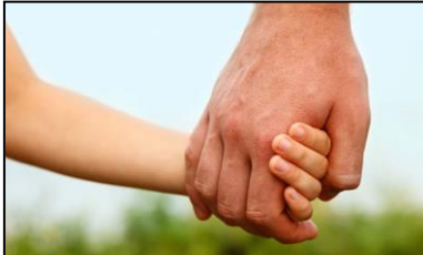
MANOS QUE DAN CONFIANZA