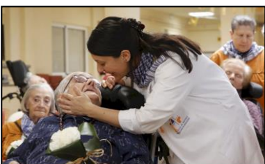
MANOS QUE DAN TERNURA