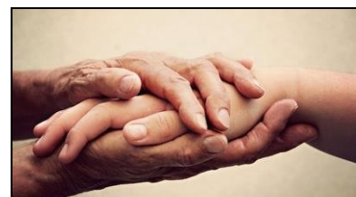
MANOS QUE SOSTIENEN y ACOMPAÑAN